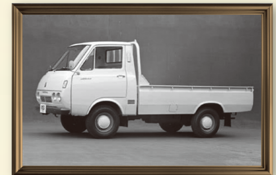
写真は【PH10型1350cc 1トン積標準ボディ】

乗り心地と操作性を重視することで、ユーザーの評判も上々で、同年ワゴン車を投入、エンジンは「トヨペットコロナRT40」と同様の1500cc77馬力の「2R型エンジン」を搭載。トラックベースでありながらワゴンとして大成功を納めます。「ハイエース」のトラックはモデルチェンジを繰り返す中で「トヨエース」及び「ダイナ」と共通の車体となり、「ハイエース」はバン・ワゴン専用となって行きます。その後「レジアス」や「グランビア」