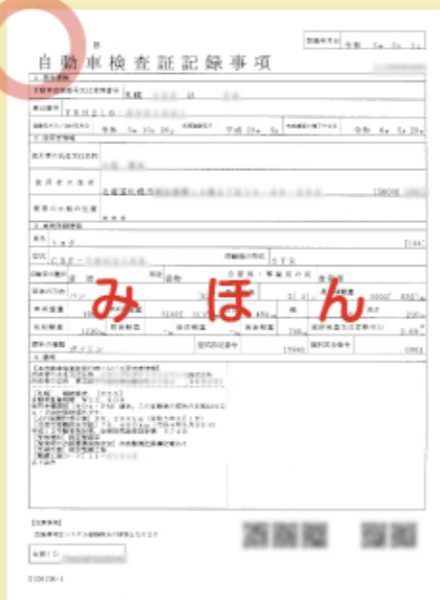
▲自動車検査証記録事項(写) A4サイズ