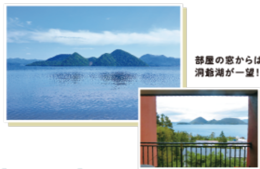
部屋の窓からは 洞爺湖が一望!