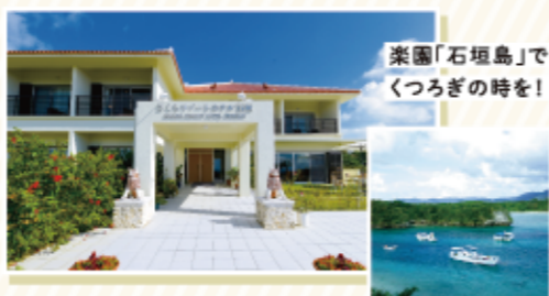
楽園「石垣島」で くつろぎの時間を!